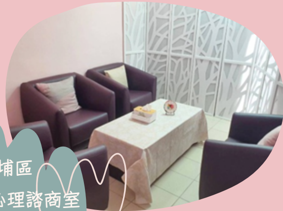
內埔區 心理諮商室

主要服務轄區以屏中地區為主轄鄉鎮包含潮州鎮、萬巒鄉、泰武鄉、來義鄉、崁頂鄉、新園鄉、東港鎮、南州鄉、林邊鄉、佳冬鄉、新埤鄉、春日鄉、枋寮鄉及琉球鄉共14個鄉鎮。