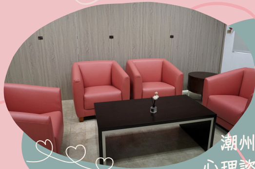
潮州區 心理諮商室